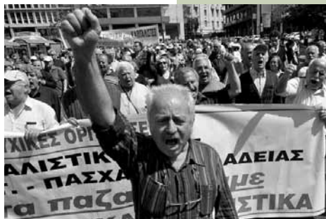
RenterInnen demonstrieren gegen Renten Kürzungen, 2009.

Die enorme hohe Arbeitslosenrate wird von einem starken Rückgang der Löhne sowie der Renten und Pensionen begleitet. Zwischen 2010 und Januar 2013 sind die Löhne und Pensionen um 35-50% gesunken und „93.1% der Haushalte haben während der Krise bereits einen Einkommensrückgang erlitten“. Zwischen 2009 und Februar 2013 lag der durchschnittliche Einkommensverlust eines Haushalts bei 38% 7 . Die Reallöhne sind im Zeitraum 2008-2011 um 12% zurückgegangen, das durchschnittlich verfügbare Nominaleinkommen eines Haushaltes ist im selben Zeitraum um 13% geschrumpft 8 . Laut dem OECD-Jahresbericht 2011 sind die Löhne in Griechenland im Jahr 2011 um den Rekordwert von 25,3% gesunken, dies ist der höchste Rückgang unter den 34 OECD-Ländern 9 . Laut dem Memorandum II ist der monatliche Bruttolohn der über 25-Jährigen seit 2012 um weitere 22%, von 751€ auf 586€ gesunken, jener der unter 25-Jährigen um 32%, von 751€ auf 511€. Dies entspricht einem Rückgang der Nettolöhne auf 427€ 10 und einem realen Lohnverlust von 30%. Mit dem Rückgang der Stundenlöhne auf 2,7€ ist ein formaler Rückgang der Löhne auf das Niveau von 2005 verbunden. Die Kaufkraft der durchschnittlichen Löhne ist jedoch auf das Niveau von 2003, die der unteren Einkommensstufen auf das Niveau der 1970er Jahre eingebrochen.