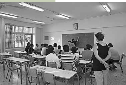
Offene Schule für MigrantInnen in Piräus

Für uns sind Solidarität, Selbstorganisation und der Kampf für einen politischen und sozialen Sturz der Regime und des Systems, die solche schlimme soziale Bedingungen fördern und zulassen drei wechselseitige und einander ergänzende Säulen unseres Widerstands und die Grundlagen, um eine Welt jenseits des Kapitalismus zu bauen.