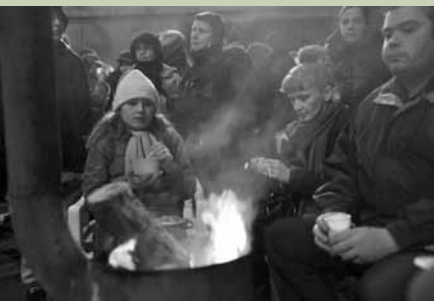
Solidarische Sylvester-Feier vor den Toren der Fabrik Hellenic Halybourgia zur Unterstützung des monatelangen Streiks der StahlarbeiterInnen