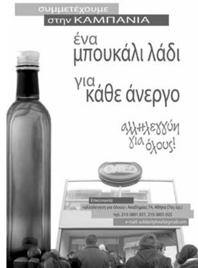
Plakat der Initiative Solidarity4All: „Eine Flasche Olivenöl für jeden Arbeitslosen“

„Solidarität für Alle“ möchte einen weiteren Punkt setzen im Kampf für ein Leben ohne Spardiktate, Armut, Ausbeutung, Faschismus und Rassismus und strebt danach, die Bedingungen für einen radikalen Politikwechsel und soziale Transformation zu schaffen.