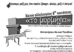
Plakat für eine Finanzierungsaktivität für das „Solidaritätsnetzwerks der sechsten Sektion Athener MigrantInnen“