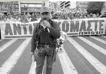
Die Gewerkschaft der öffentlichen Energieversorgung während eines Generalstreiks 2011

rechnung eingezogen wird, führen dazu, dass „40% der Haushalte in Zahlungsverzug gegenüber dem Staat oder einer Bank geraten sind und 50% nicht mehr über ausreichend Mittel verfügen, Wasser, Strom oder Zinsen zu bezahlen“ 24 . Laut dem Präsidenten und Management Direktor der DEH (staatliches Elektrizitätsunternehmen) wurden 2011 bereits 400.000 Vereinbarungen zur Begleichung unbezahlter Rechnungen abgeschlossen, im Laufe des Jahres 2012 erhöhte sich diese Zahl