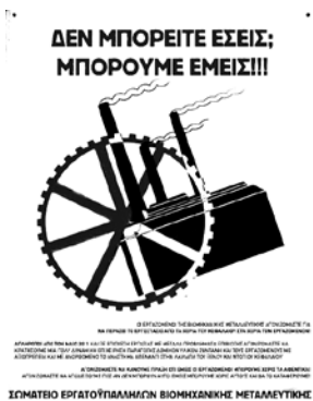
Plakat der rückeroberten und unter ArbeiterInnenkontrolle produzierenden „Industrial Met. Co“ (2012)

2-3 Zeitbanken, die als geschlossene Strukturen in größeren Gruppen existierten. Seit den Memoranden gibt es davon ungefähr 12, die verschiedene Organisationsmodelle anwenden. Der größte Unterschied zu den früheren Projekten besteht darin, dass die Kollektive, die sie initiiert haben, sie als Werkzeuge zur Organisation, zum Widerstand gegen die Krise und zur Verteidigung des öffentlichen Raums konzipiert und sie in die Entwicklung der Solidaritätsstrukturen in den Nachbarschaften integriert haben.