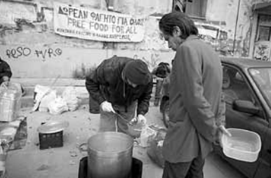
Soziale Suppenküche des Kollektivs „Der andere Mensch“

Sammlung von Essensspenden am Ausgang eines Supermarkts in Athen durch den „Zug der Solidarität“